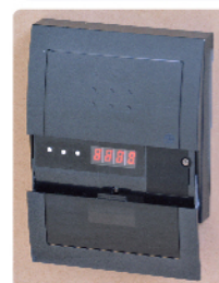
▲カバーオープン時